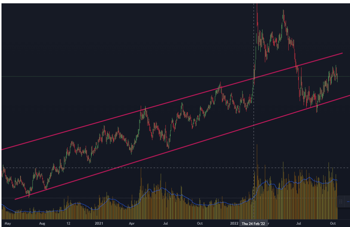
Gráfico 15. Commodity Trigo de Mayo 2021 a Octubre 2022

Por otra parte, el presidente de la federación rusa, país que reclama territorios ucranianos, ha lanzado una invasión que tuvo por fecha de comienzo el 24 de febrero de 2022.