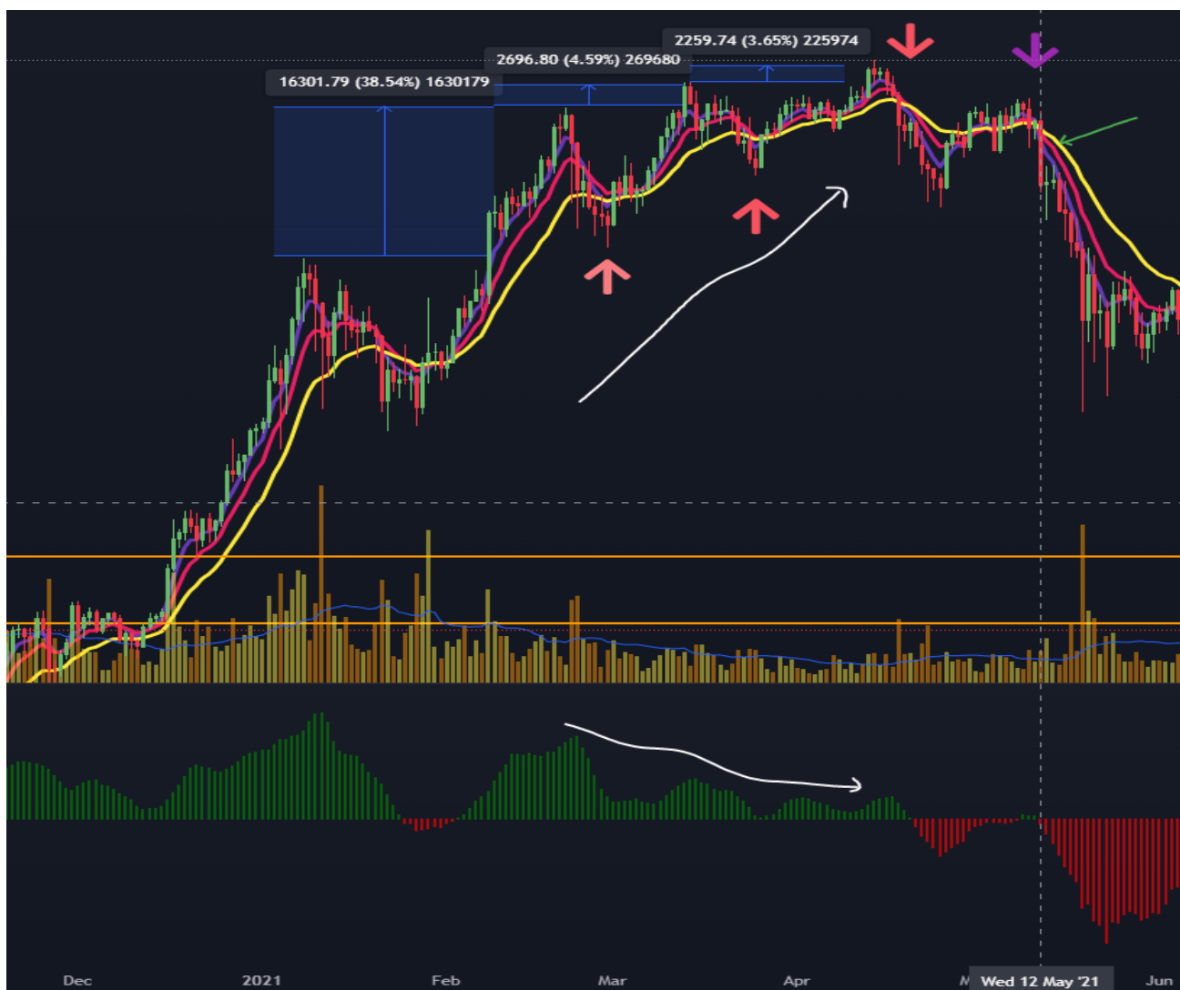
Gráfico 8. Bitcoin en Noviembre 2020 a Junio 2021

Con riesgo a entrar a el terreno de suposición, es muy probable que por esas fechas hubiésemos encontrado un cambio de tendencia sin necesidad del Tweet, quizás simplemente aceleró algo que inevitablemente iba a suceder, de nuevo, por supuesto que es imposible determinar qué hubiese pasado sin el Tweet, pero todo indicaba un inminente cambio de tendencia.