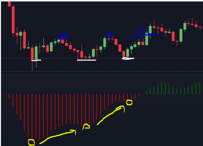
Gráfico 5. Bitcoin Marzo y Abril 2022

Las divergencias se encuentran cuando el precio no acompaña al instrumento con el cual se compara. Por ejemplo, si el precio sube, pero el volumen transaccionado baja, estamos en presencia de una divergencia de volumen . Si el gráfico baja, pero el oscilador EWO sube, se le conoce como una divergencia de oscilador o divergencia del EWO .