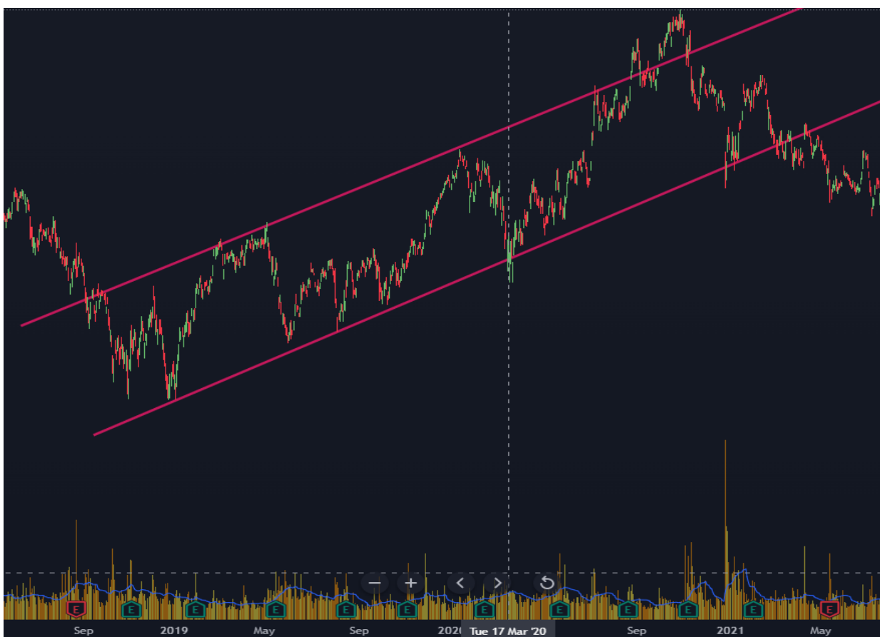
Gráfico 18. Alibaba de Agosto 2018 a Junio 2021

El gráfico a continuación, si bien tiene una caída por las fechas mencionadas, su fluctuación no difiere de las que venía teniendo y casi en su totalidad permanece dentro del canal alcista.