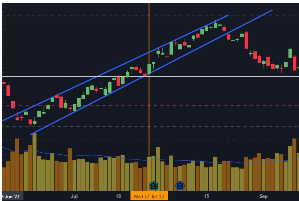
Gráfico 12. Gráfico Apple Junio a Septiembre 2022

En el caso de Apple, donde tiene una tendencia alcista que se mueve sobre el canal delimitado por las líneas azules, vemos como, si bien realiza una subida continuando con la tendencia, no logra un cambio significativo dentro de los movimientos que venía teniendo el mercado.