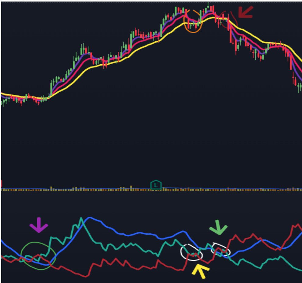
Gráfico 6. Netflix de Septiembre 2022 a Enero 2022