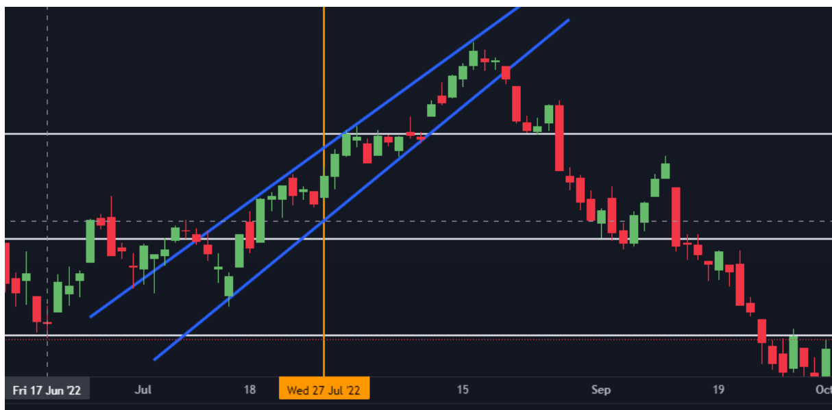
Gráfico 13. Dow-Jones Industrial Average Junio a Octubre 2022

Estos cuatro casos de activos distintos entre sí por su naturaleza demuestran que, una vez más, el análisis técnico provee suficiente información para tomar una decisión por el hecho de que la noticia proveniente del análisis fundamental no ha causado ninguna repercusión en los gráficos. En otras palabras, la hipótesis nuevamente es correcta.