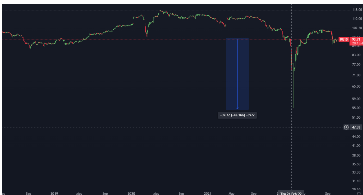
Gráfico 16. Bono de 10 años de la Federación Rusa de Julio 2019 a Octubre 2022

Cabe aclarar que el precio del maíz y de la cebada han sufrido alteraciones similares, pero considero que agregar sus gráficos no vale la pena dado que son similares al del trigo.