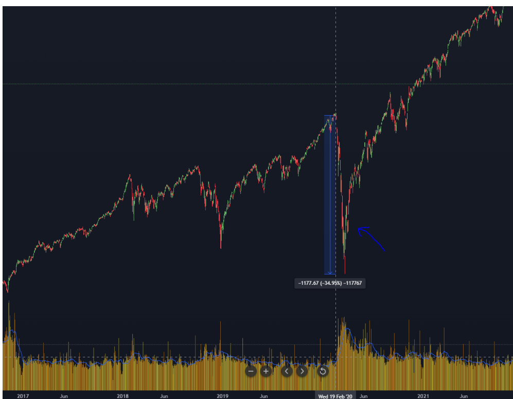
Gráfico 17. S&P500 Index de Febrero 2017 a Diciembre 2021