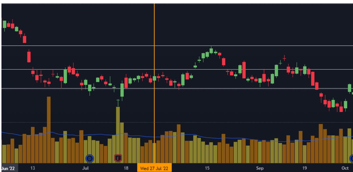
Gráfico 11. Banco JP Morgan Junio a Octubre 2022