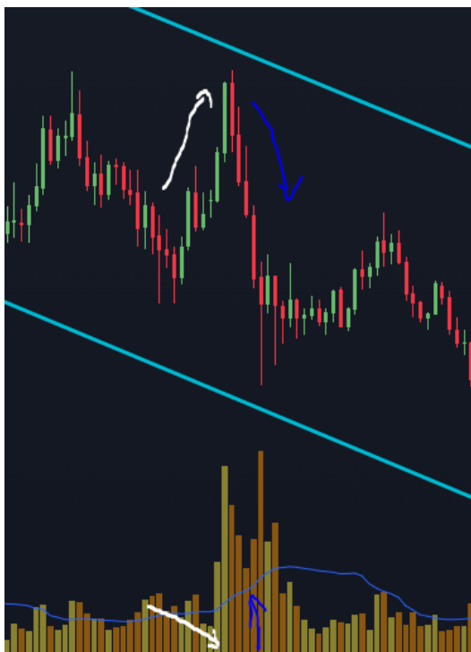
Gráfica 1. Gráfico del precio de Cardano (ADA) el mes de enero 2022

En el caso de que encontremos un activo con una tendencia alcista y exista un movimiento bajista que no tenga volumen acompañándolo, se podría considerar como nulo dicho intento de cambio de tendencia y se interpreta como que seguirá la tendencia alcista.