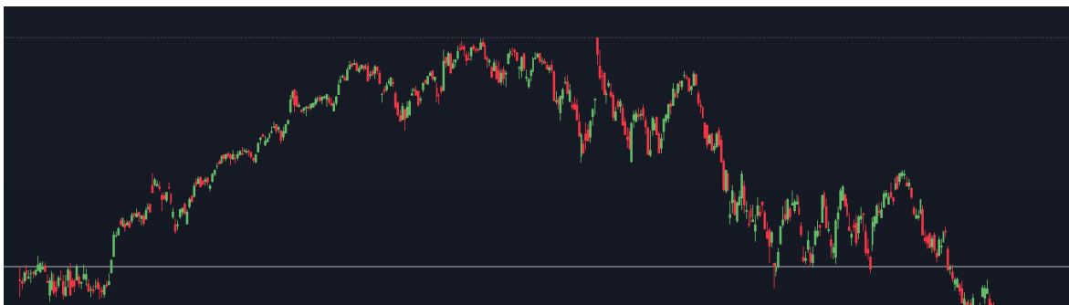
Gráfico 4. Google de Enero 2021 a Septiembre 2022

Ambos precios toman mayor relevancia según la cantidad de rebotes que ocurren en el mismo.