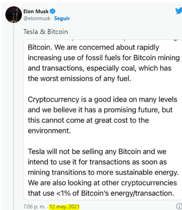
Imagen 7. Tweet de Elon Musk el 12 de Mayo de 2021

El 12 de mayo realiza un Tweet que por varios motivos que no vale la pena detallar, cancela la compra de la criptomoneda.