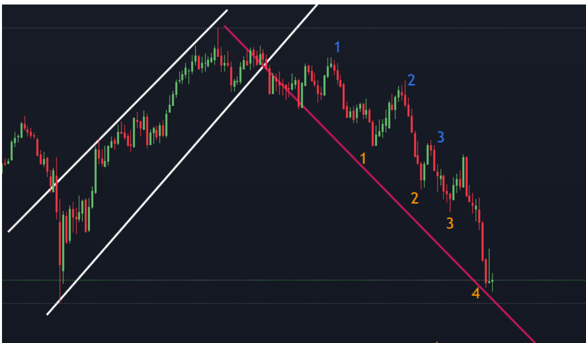
Gráfico 3. Dólar neozelandés contra dólar estadounidense

Cuando una tendencia es alcista, el mínimo y el máximo se encuentran por arriba de los mínimos y máximos anteriores, cuando es bajista por debajo y cuando es lateral se encuentran en el mismo nivel.