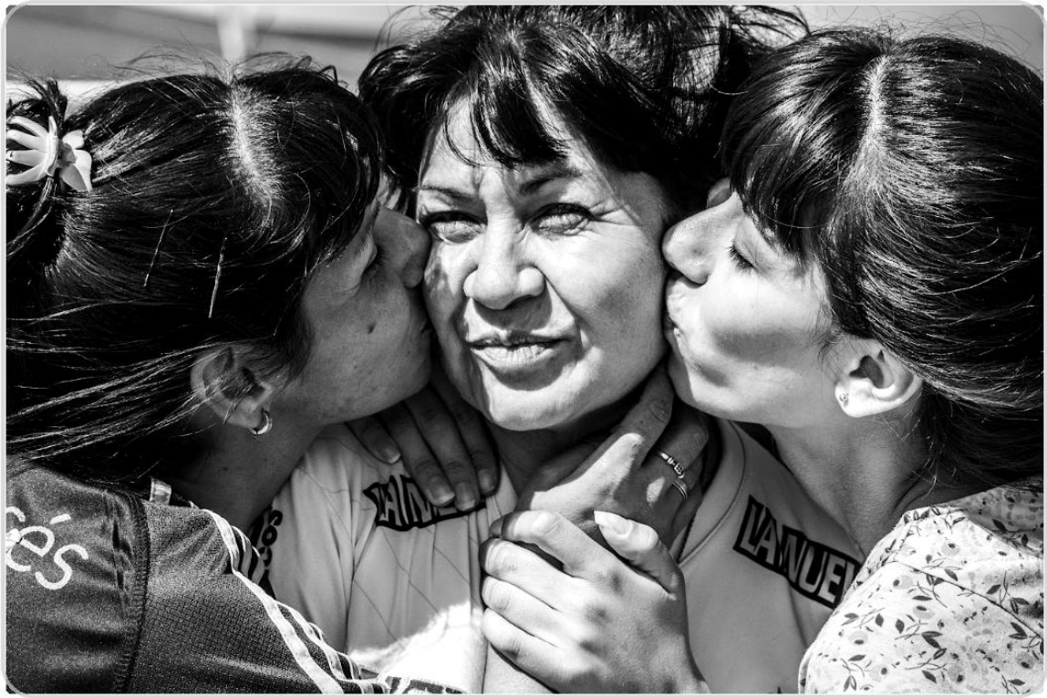
Foto 6. "Mamá adoptiva". Construcción de lazos de cuidado y pertenencia en el contexto de encierro