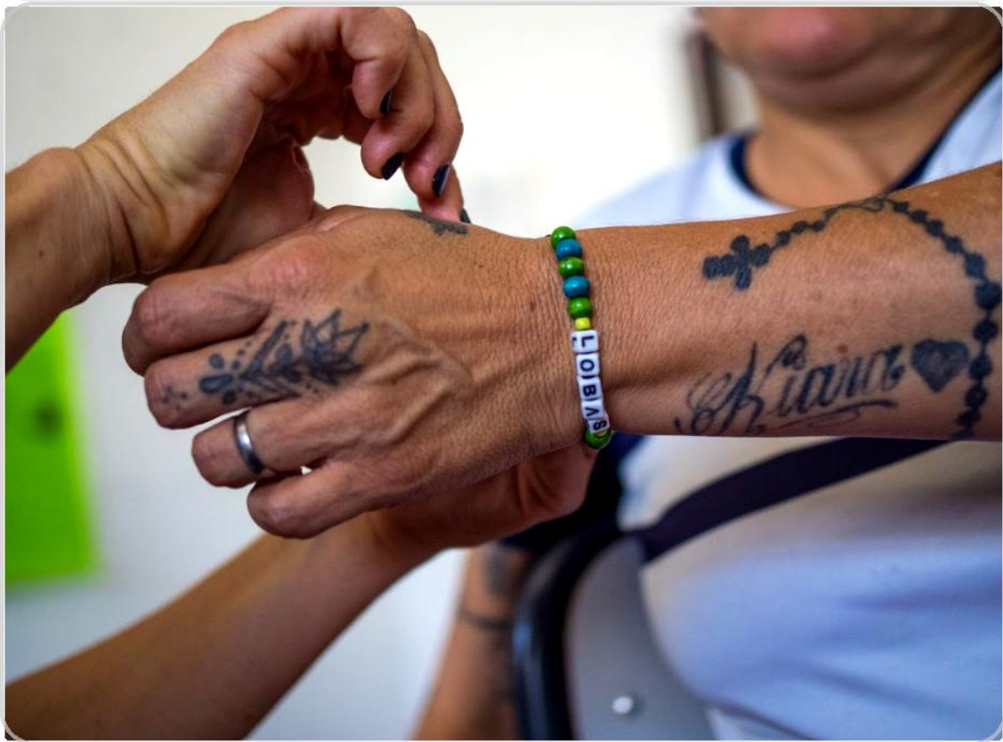
Foto 16. Objetos, tatuajes y marcas que condensan tiempo biográfico y pertenencia.