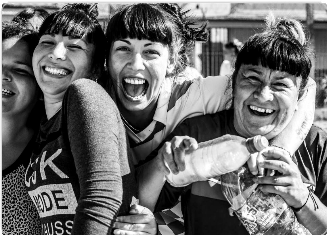
Foto 5. Expresiones de alegría y complicidad entre compañeras.