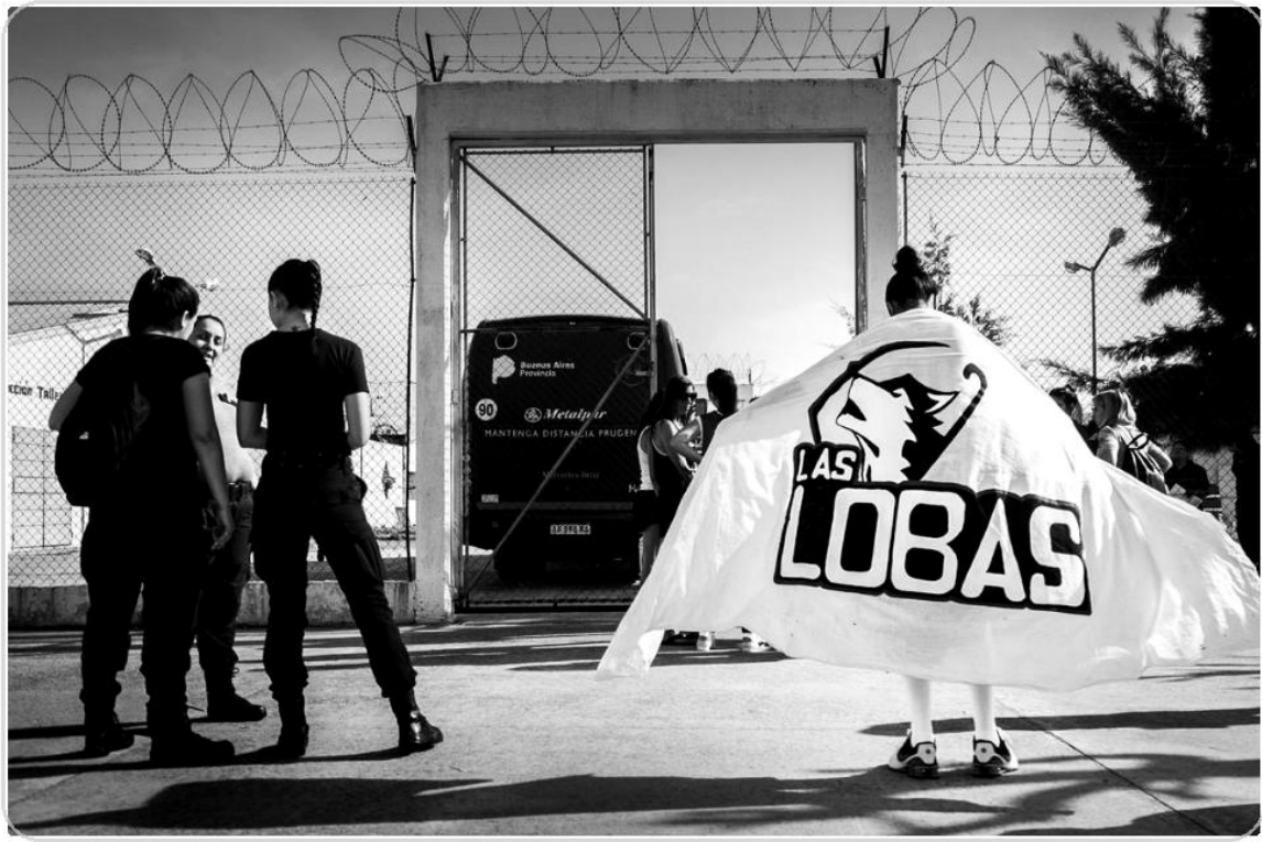
Foto 14. Bandera del equipo en el umbral entre el encierro y la salida a jugar en un club.