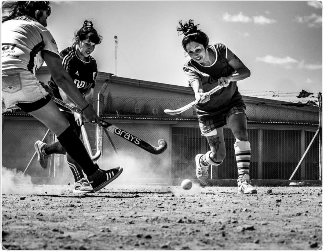
Foto 19. Disputa de la bocha durante el juego.