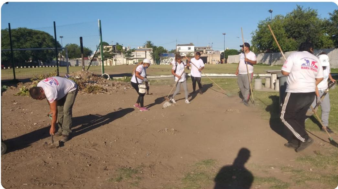
Foto 40: Mujeres y hombres del barrio preparan la cancha para que comience el juego.