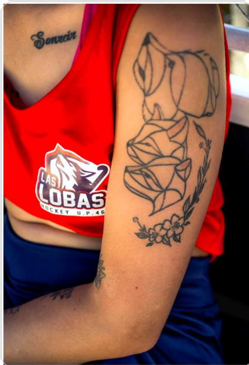
Foto 8. Tatuaje alusivo a la identidad del equipo.