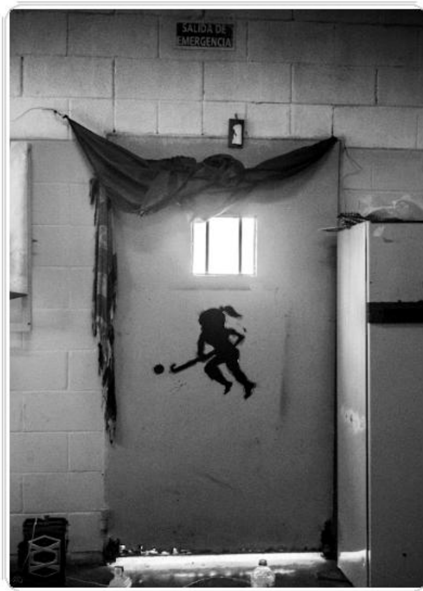
Foto 10. Intervención visual en un espacio de circulación interna.