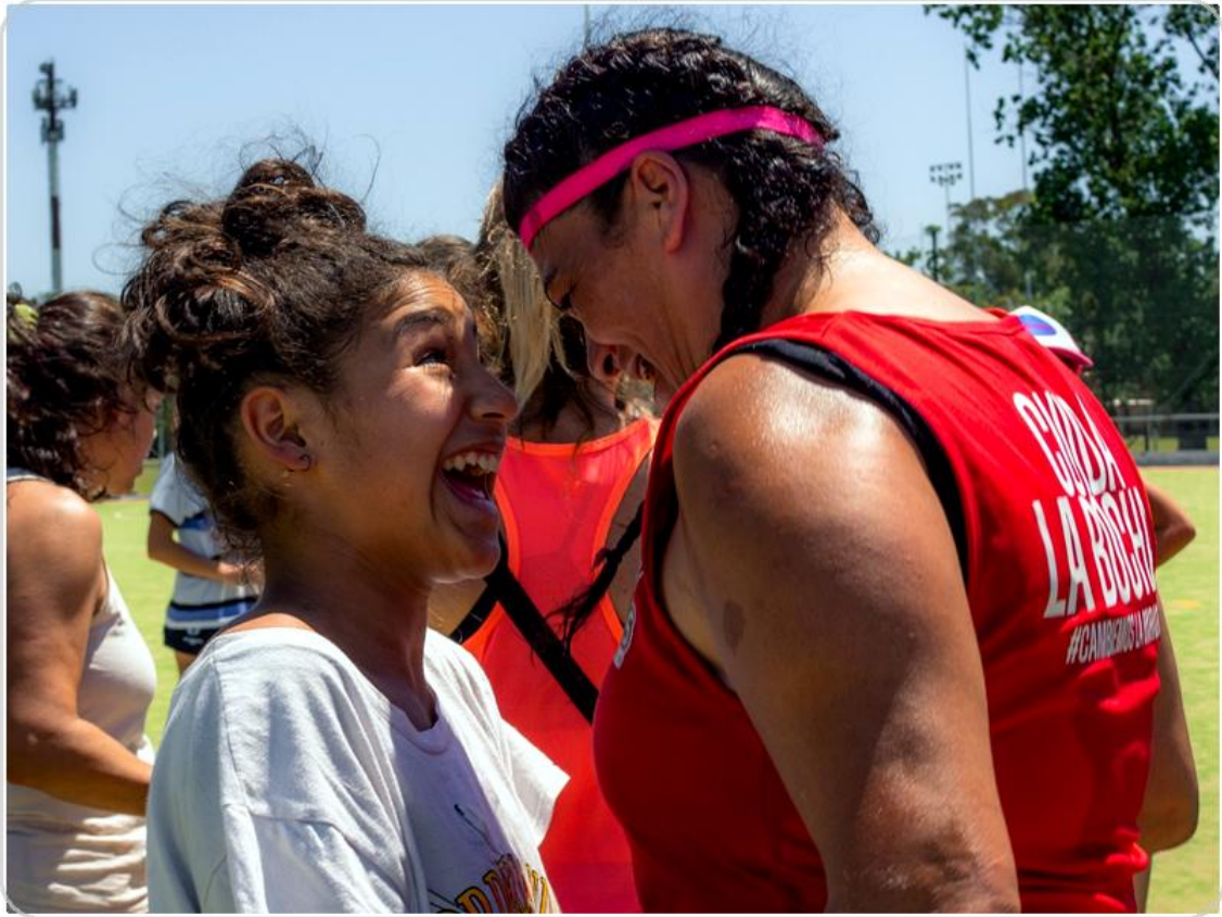
Foto 31. Cercanía y risas al aire libre.