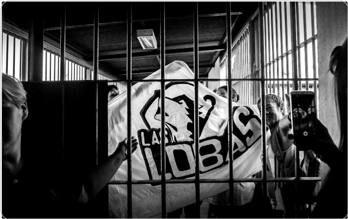
Foto 15. Emblema colectivo observado desde el interior del pabellón.