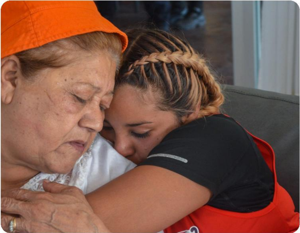
Foto 32. Abrazo de abuela y nieta después de mucho tiempo.