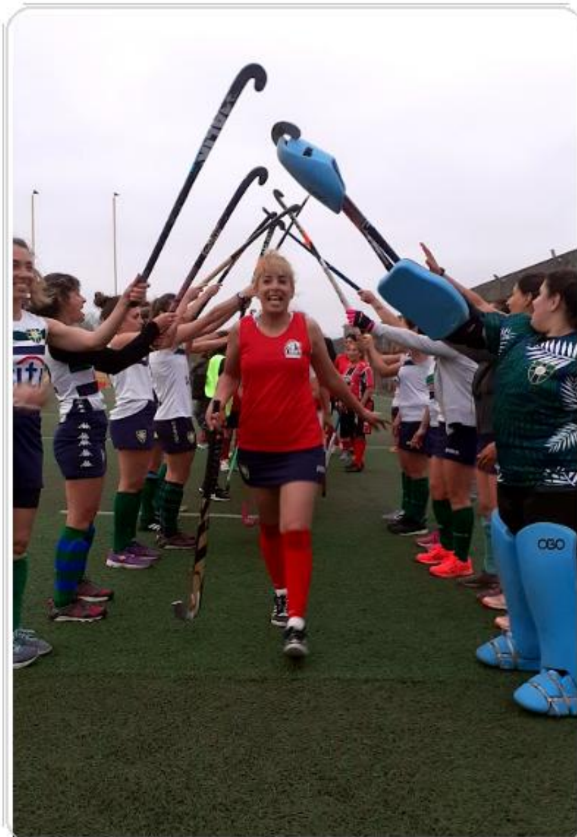
Foto 24. Ingreso a la cancha entre saludos cruzados.