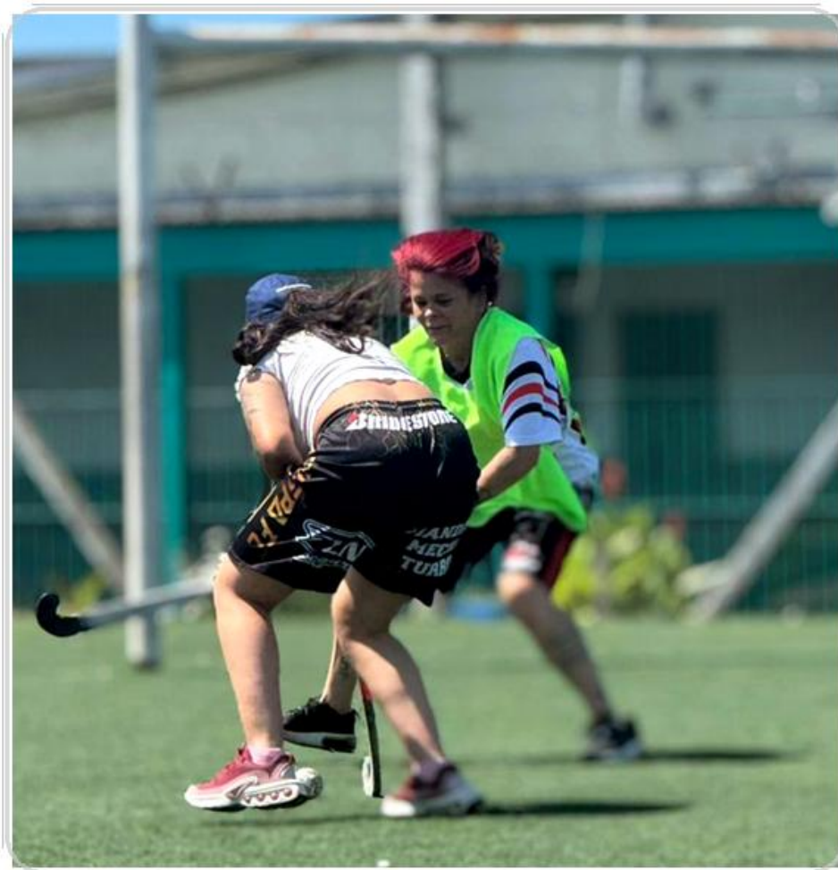
Foto 21. Cuerpos que disputan el control y el disciplinamiento del encierro.