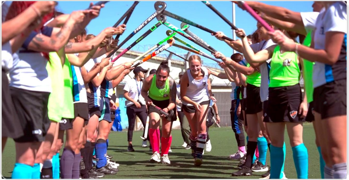
Foto 22. Final del partido con equipo visitante.