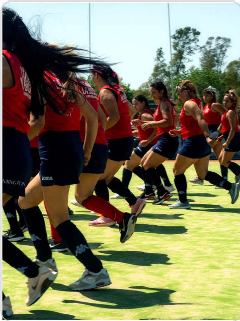
Foto 20. Entrada en calor previa a partido extramuros.