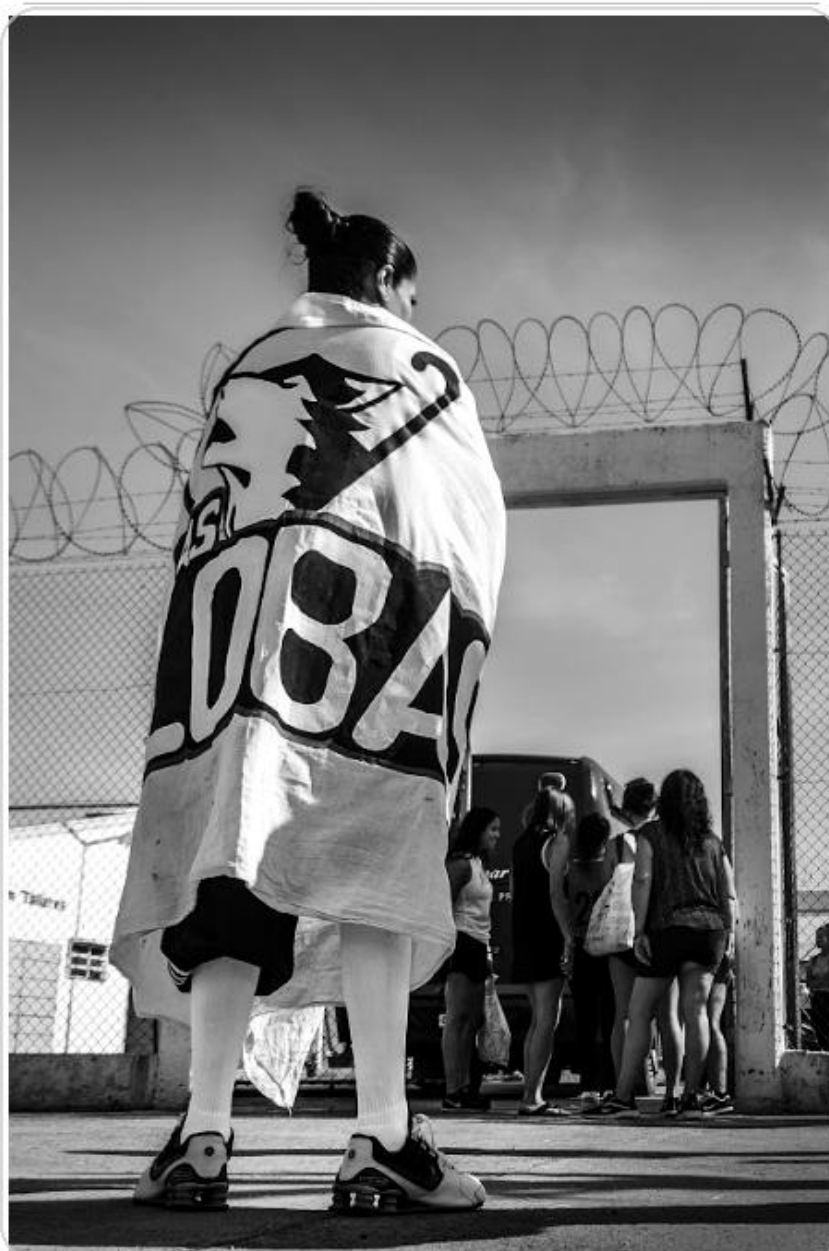
Foto 11. Salida extramuros con indumentaria y emblemas del equipo.