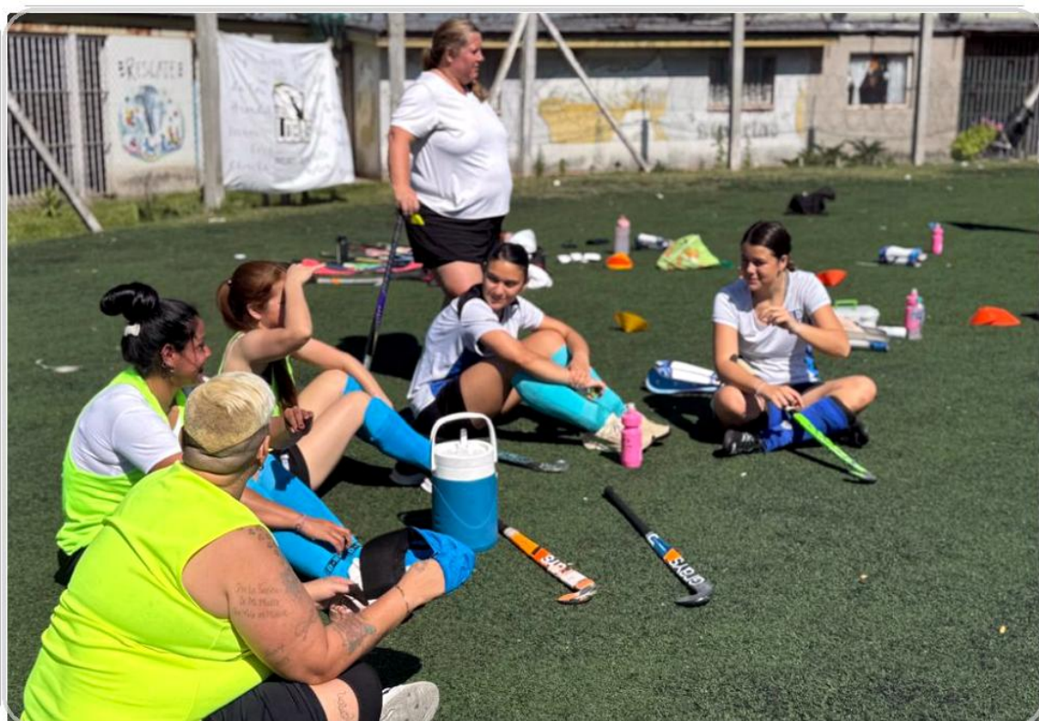
Foto 25. Intercambio posterior al partido con equipo visitante.