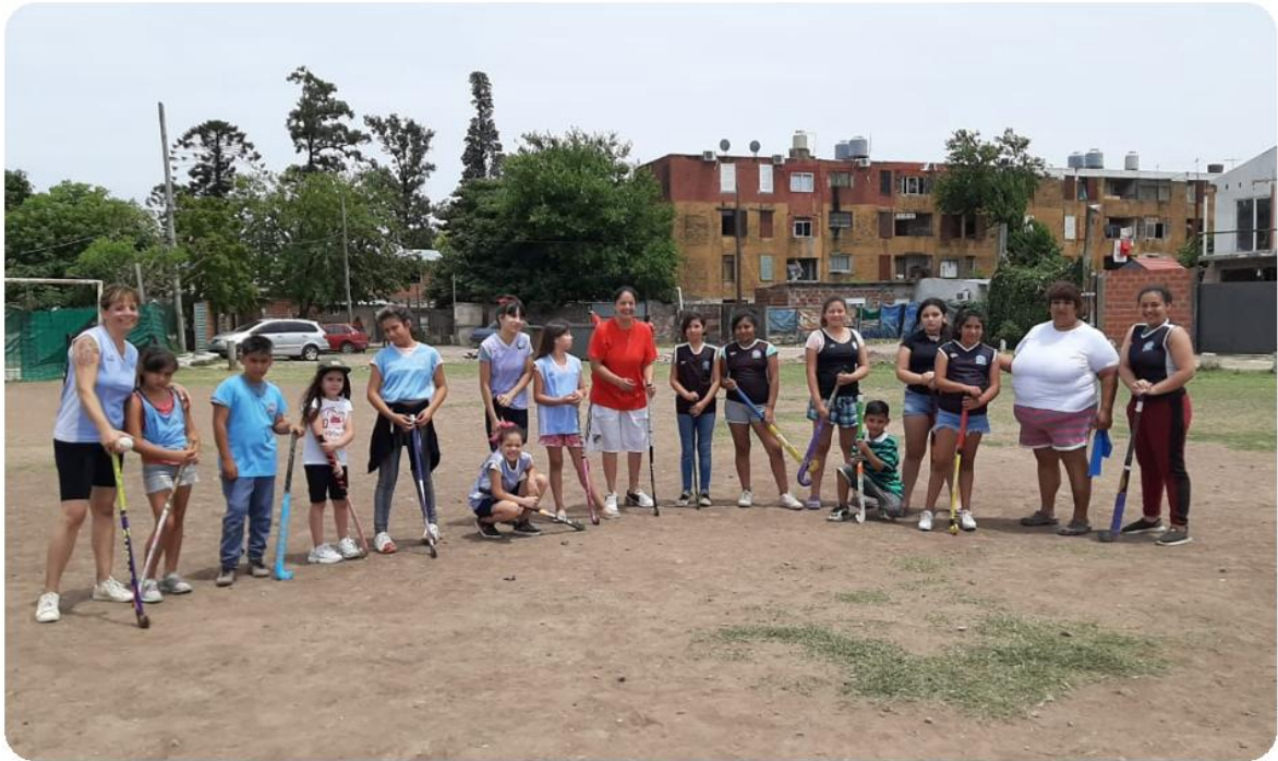
Foto 39. “Las Lobas... falta el nombre para el equipo de acá”. (Nanci, 2021).