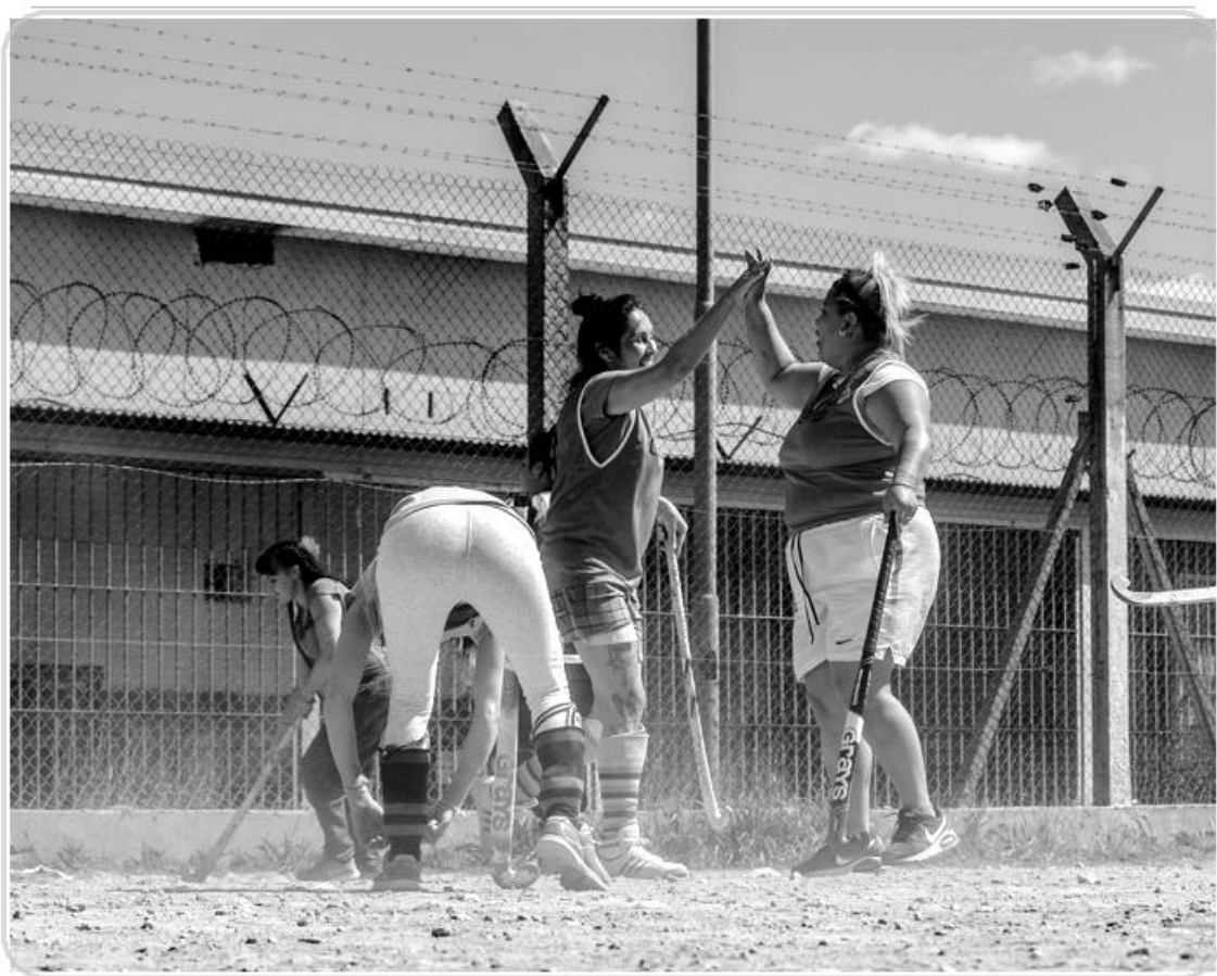
Foto 18. Festejo de gol.