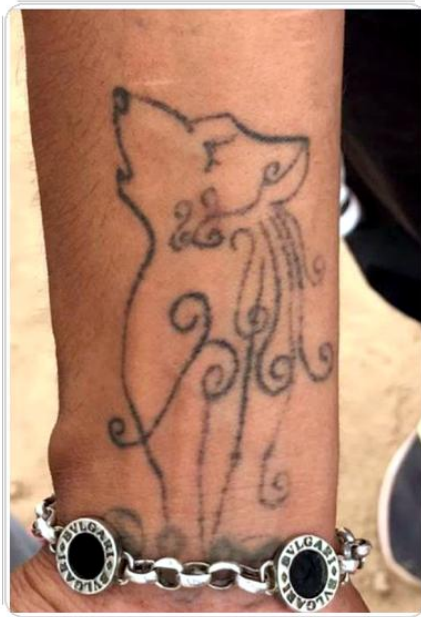
Foto 9. Símbolo corporal de pertenencia y reconocimiento grupal.