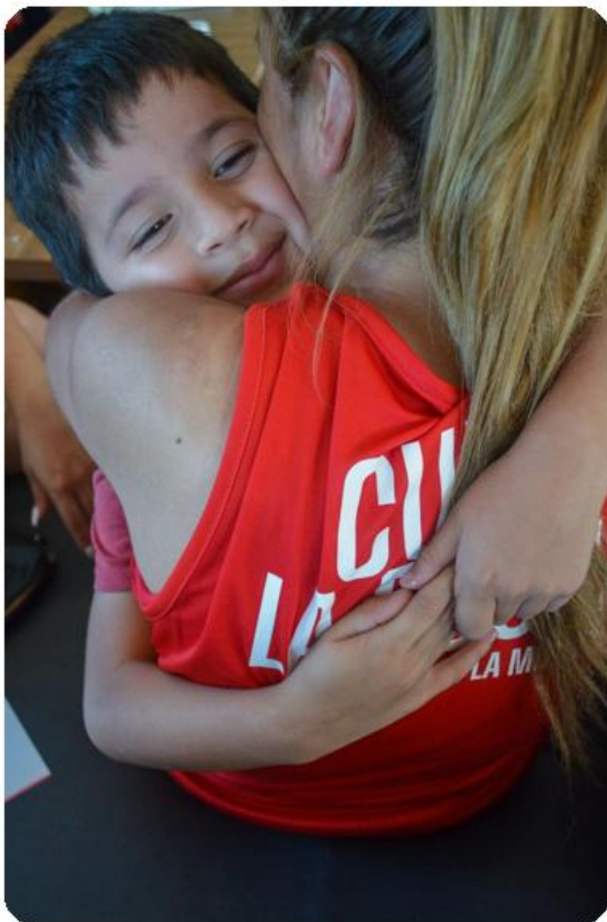
Foto 33. Partido extramuros. Cercanía, ternura y presencia