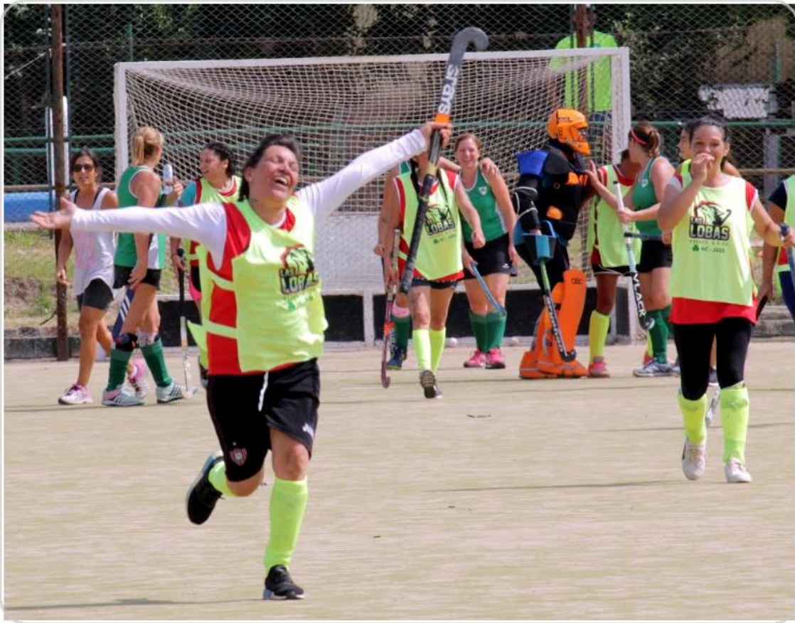
Foto 3. Escenas de celebración y entusiasmo durante la práctica deportiva.