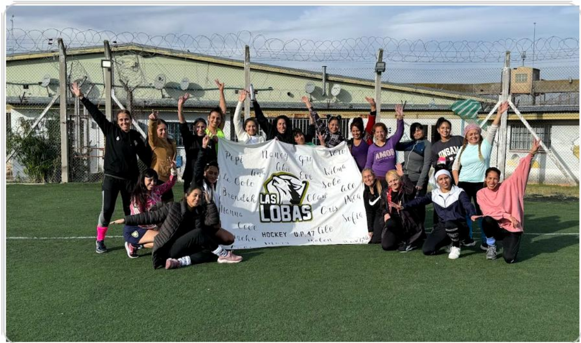
Foto 12. Foto de equipo con la bandera de Las Lobas.