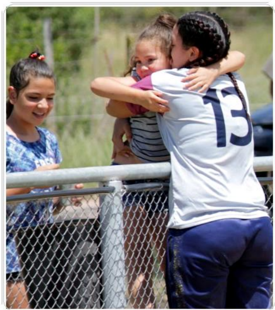
Foto 28. Reencuentro y abrazo junto al alambrado.