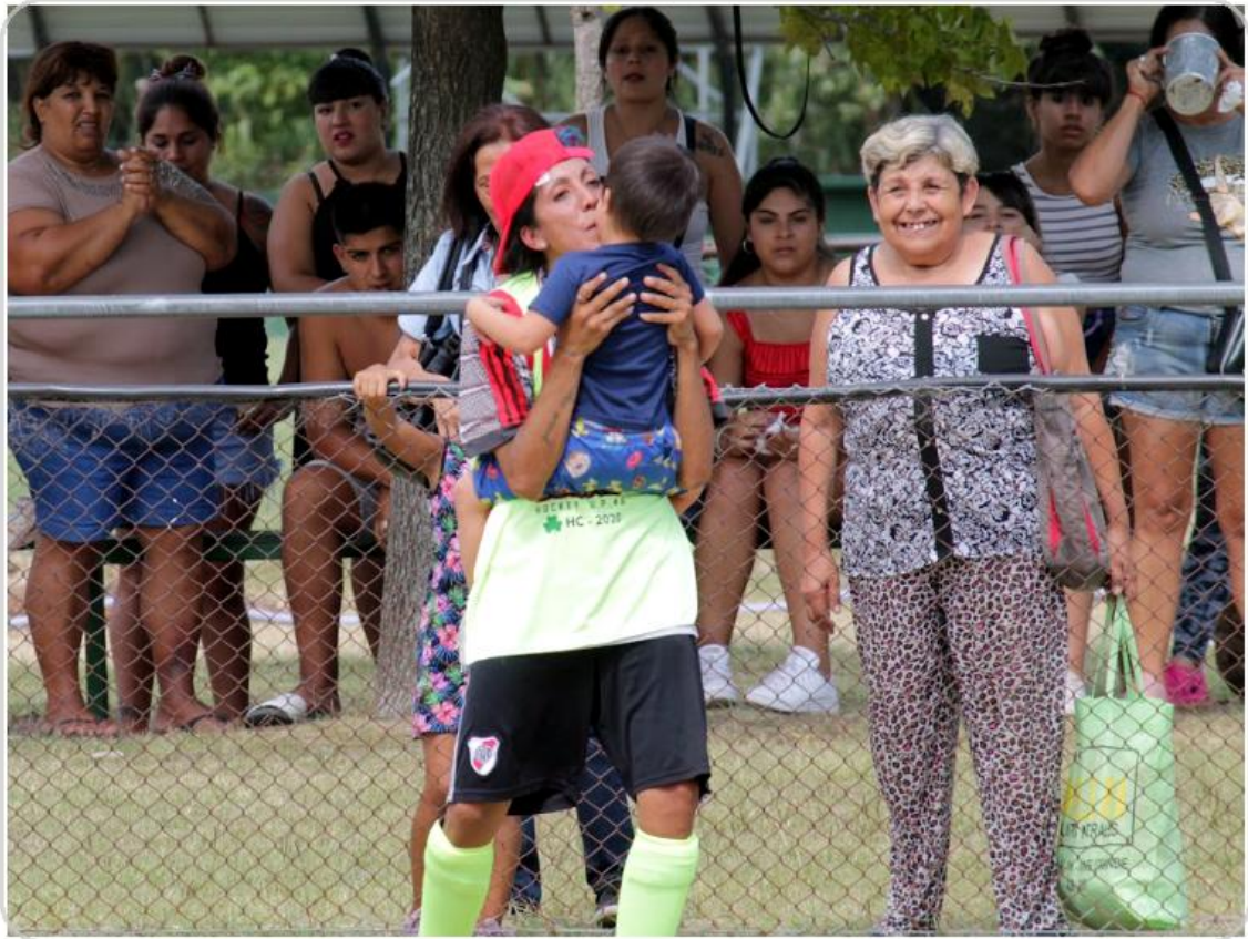
Foto 29. Acompañamiento de las familias durante los partidos extramuros.