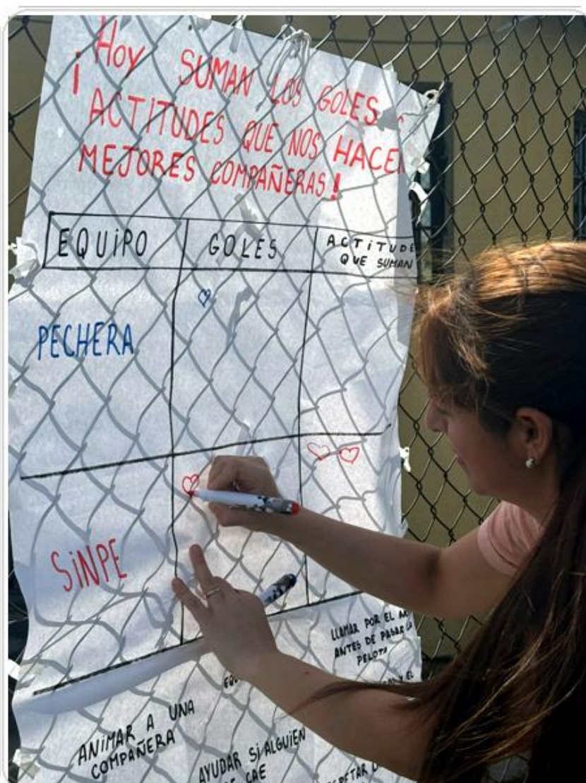
Foto 1. Registro de goles y actitudes en el marco de la práctica participativa “Sumar goles y Actitudes”.