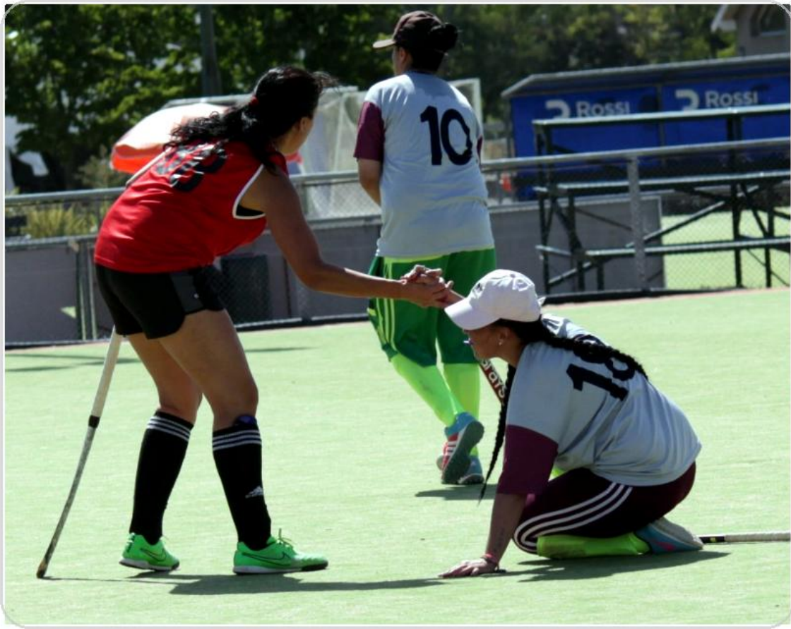
Foto 17. Asistencia entre jugadoras durante el partido.