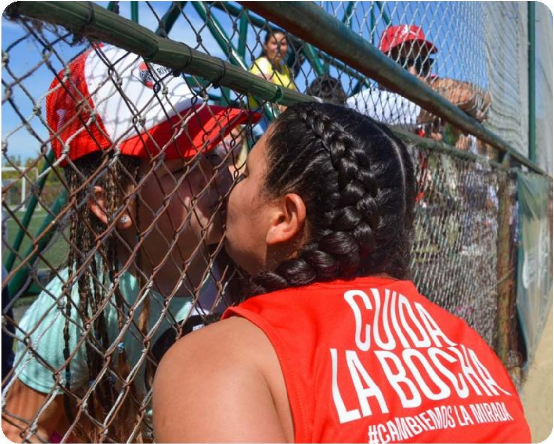
Foto 34. Amor que se abre paso incluso en condiciones de encierro