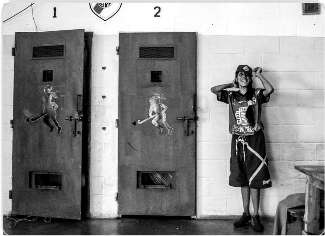
Foto 13. Puertas de celdas intervenidas, en el interior del pabellón.