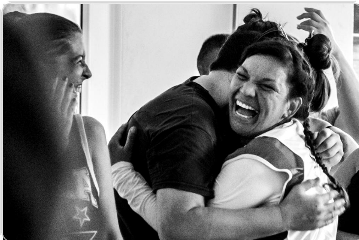
Foto 30. Abrazo y emoción compartida.