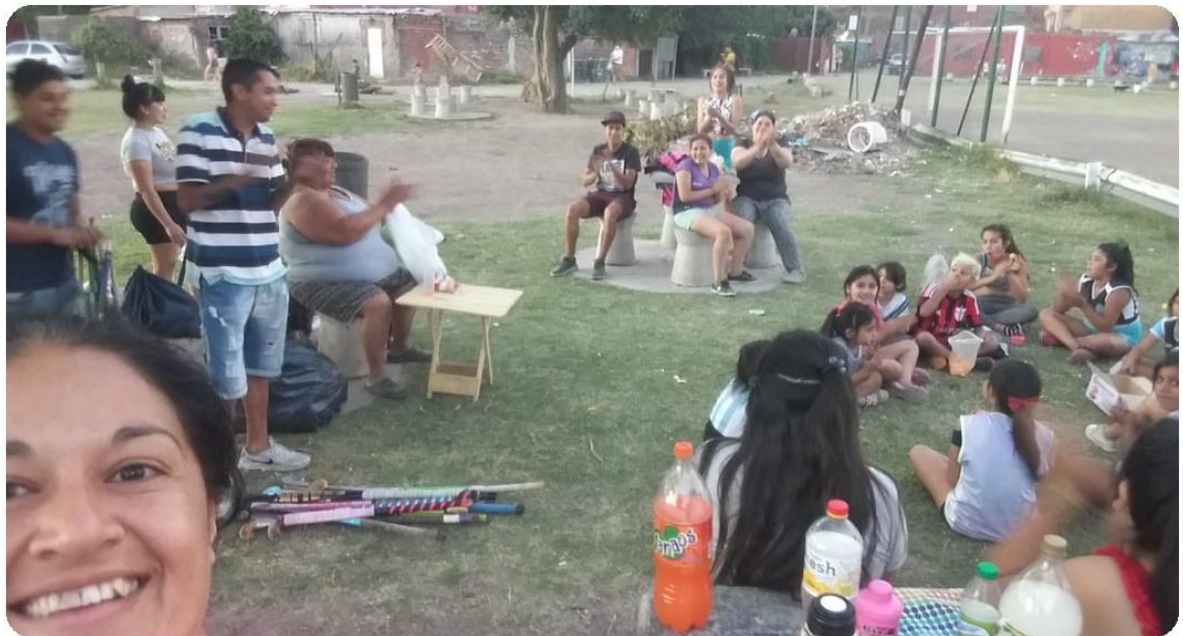
Foto 38. Tercer tiempo en comunidad barrial