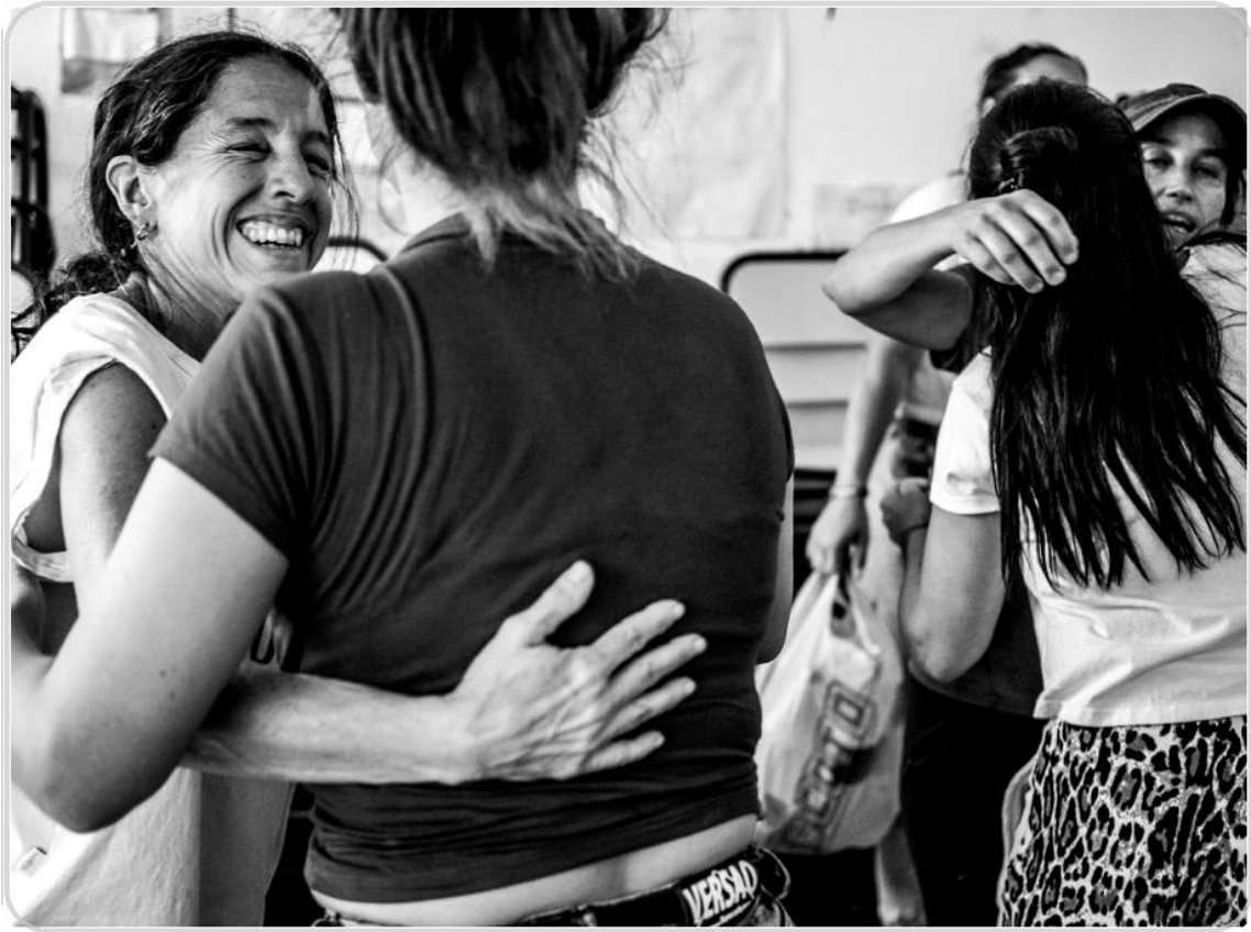
Foto 23. Abrazo de bienvenida entre participantes.