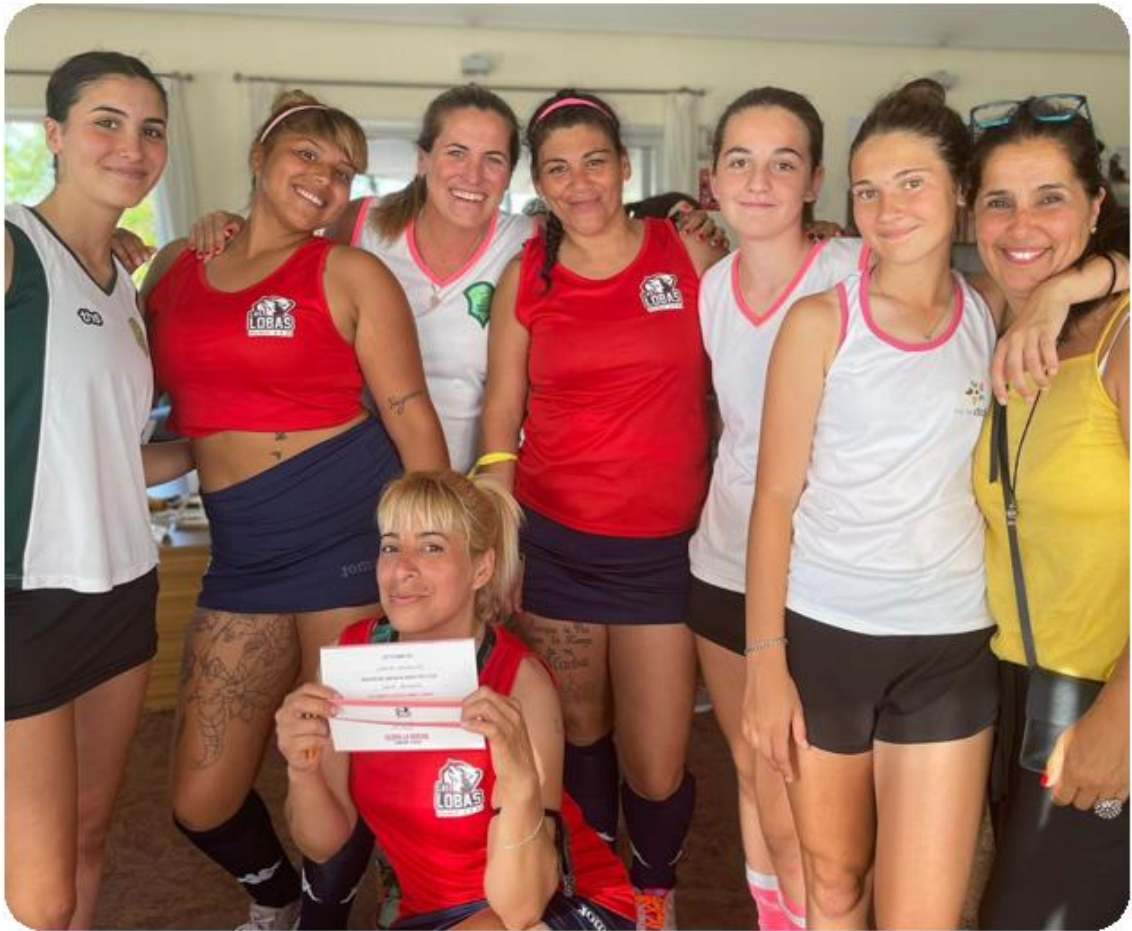
Foto 26. “Cambiar la mirada”. Las Lobas y equipo local extramuros.