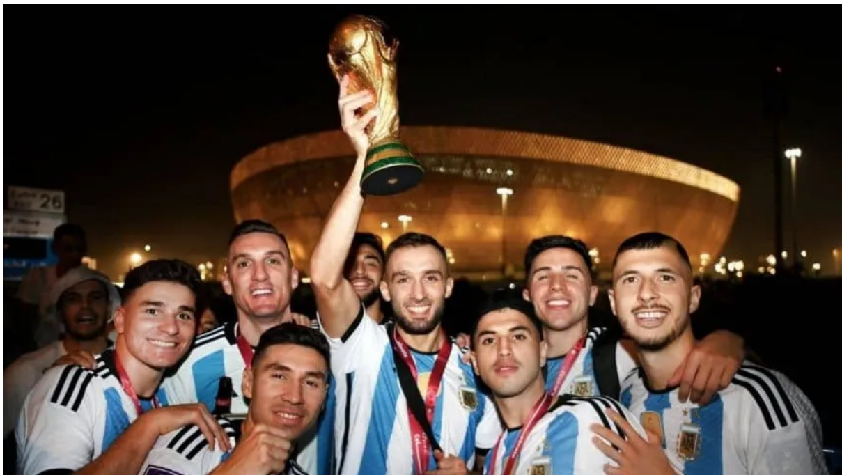
6 ex alumnos de un mismo Instituto, 6 deportistas de alto rendimiento alumnos, 6 campeones del mundo

Buscamos, entonces, a través de este trabajo, conocer cómo es la vida deportiva y escolar de los alumnos DAR 2 en la etapa de orientación específica del nivel secundario, explorar qué dificultades se les presentan y si esas problemáticas les permiten compatibilizar, y de qué manera, sus dos responsabilidades: el juego y el estudio.