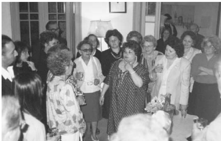
Inauguración en el Museo de Concordia, Entre Ríos, de la Expo “Modos y Modas”, en noviembre de 1987.