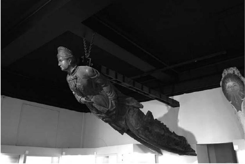
Mascarón de proa del barco Duchess of Albany que representa a la princesa Helena Federica Augusta. Se encuentra expuesto en el interior del Museo.