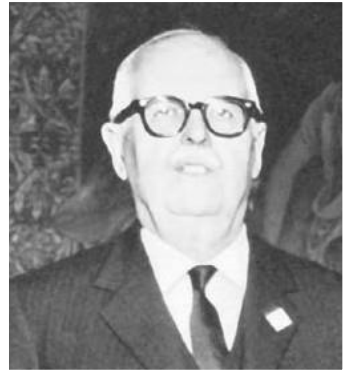
Bernardo Houssay, 1964.