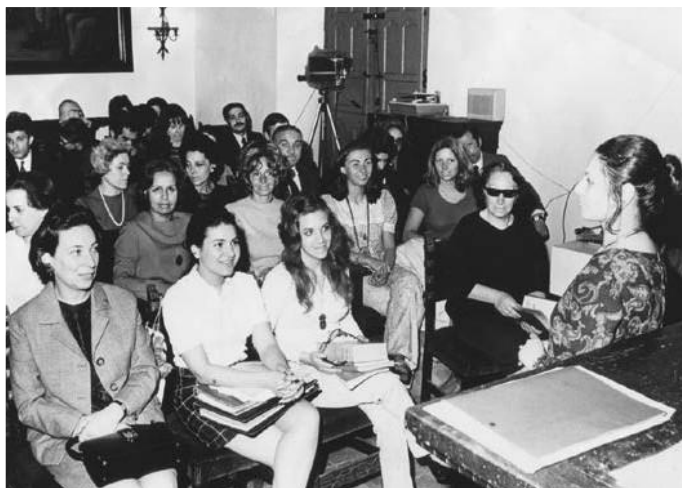
Con alumnos de la primera camada del curso de museología de la ENaM, Sala-auditorio del Cabildo de Buenos Aires, 1972.