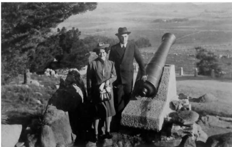
Los padres de Susana Speroni en una visita a Tandil.