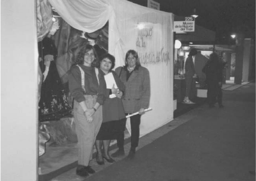
Stand “El sueño de un ensueño” en INNOVA, 1988.