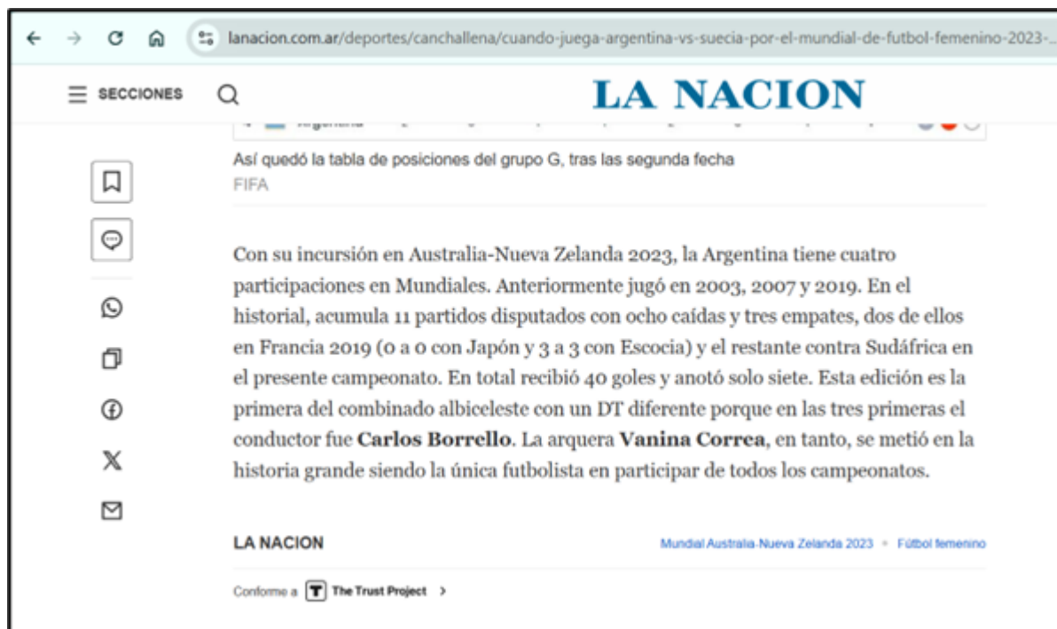
Ejemplo 1: La Nación 31/07/2023

Por otra parte, y a diferencia de Clarín , en La Nación se encontraron similitudes en muchas de las notas publicadas sobre su estructura y contenido. En algunos casos la información era la misma, pero se expresó con otras palabras. En otros, se detectó que algunos párrafos se repitieron entre una publicación y la otra. Sobre este último punto, hay un caso donde un párrafo se repite en 6 notas diferentes. A continuación, ejemplifico alguno de los casos: