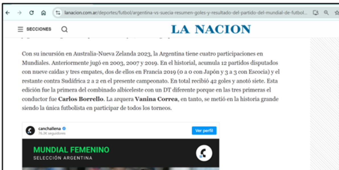
Ejemplo 3: La Nación 02/08/2023

En línea con lo anteriormente mencionado, La Nación agregó a lo largo del contenido y de sus publicaciones un párrafo para difundir cuánto pagaban las casas de apuestas deportivas en cada partido que jugó Argentina. Esto no se mencionó en