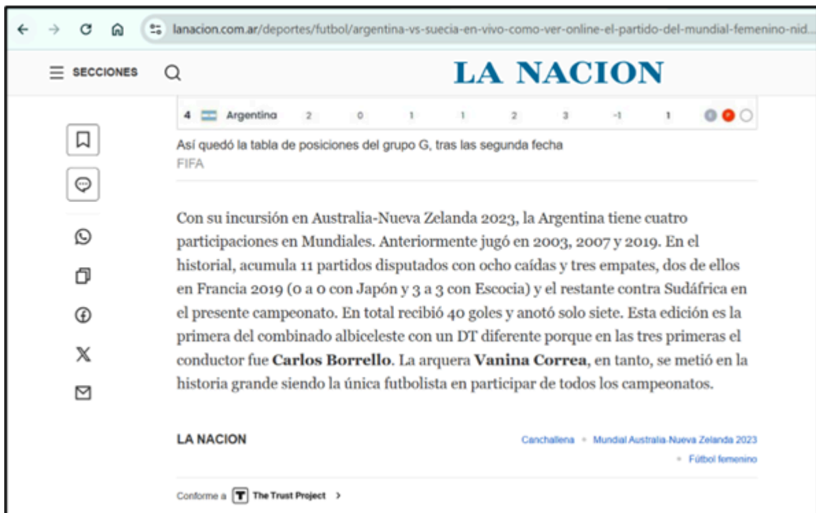
Ejemplo 2: La Nación 01/08/2023