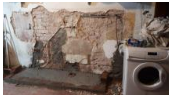
Fig.1: Garaje en remodelación.

Luego de meses trabajando en conjunto con su familia en donde tuvieron que picar paredes, realizar instalaciones eléctricas, de agua, de azulejos, levantar una pared, realizar muebles, etcétera, finalmente pudo inaugurar su cocina, y con ella, Che, Lú .