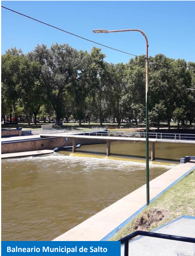
Balneario Municipal de Salto

Por estos motivos me parece muy importante mencionar lo que el entrevistado” afirmó, (Caif, 2021) “Argentina viene siendo pionero a nivel Sudamérica y Latinoamérica en esta modalidad”. “Será la primera vez en la historia de Latinoamérica que se celebrará el Kayak Freestyle” (Nautical News Today, 2017).