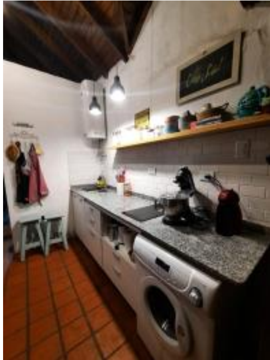
Fig.2: Cocina finalizada.