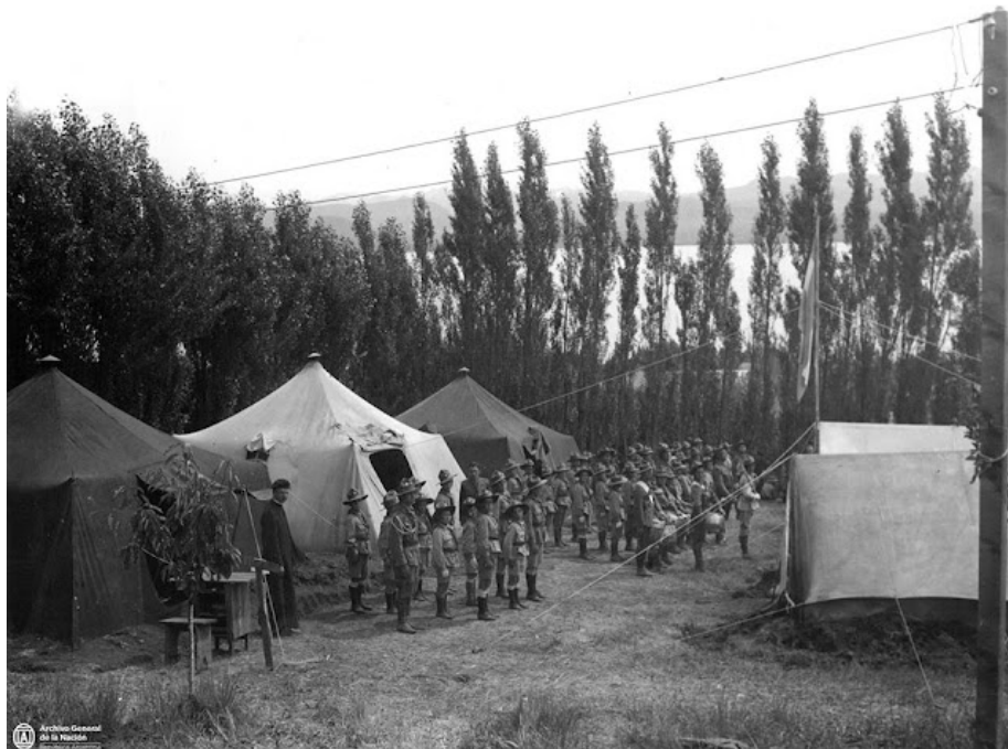
Un momento del campamento de boy- scouts. Río Negro, 1946. Fuente: Blogspot Fotos Antiguas de Mendoza, Argentina y el Mundo de cada década desde 1880

Según Scouts de Argentina Asociación Civil, a principios del siglo XX en la línea Sur de los ferrocarriles del Gran Buenos Aires (actualmente el ex Ferrocarril Roca), trabajaban algunos ingenieros británicos que habían conocido el Movimiento Scout en Europa, o habían leído Escultismo para Muchachos . Aquellos inmigrantes fueron quienes iniciaron la creación de grupos scout en los colegios británicos e inmediatamente se fueron abriendo grupos en los colegios nacionales, en los cuarteles de bomberos y las comisarías.