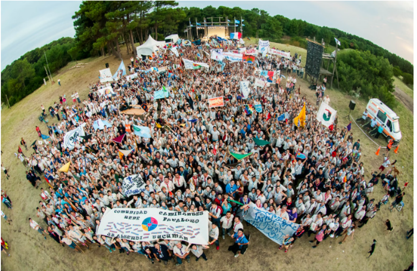
Sosneado 2015