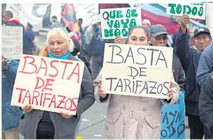
Figura 7: Tapa diario Página 12, lunes 13 de noviembre.

Para Página 12 , el tema central en aquel momento era el aumento de tarifas. Eso lo podemos observar en el centro de la tapa. Como titular encontramos un juego de palabras que ironiza con las medidas del gobierno: “Temporada de tarifazos”, como si de una serie se tratara. El término “tarifazo” es utilizado para hablar despectivamente del aumento de un servicio; su selección por sobre otras palabras no es casual.