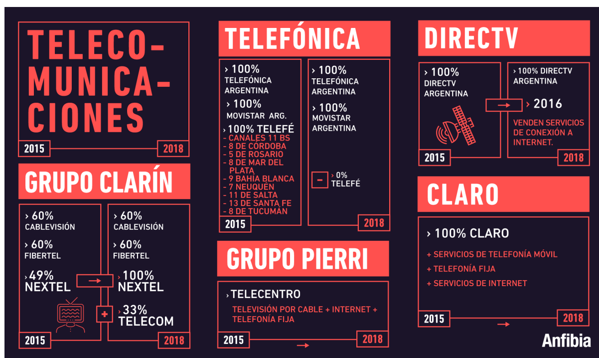
Figura 2: Expansión de las telecomunicaciones durante el gobierno de Macri.

En el siguiente gráfico podemos ver cuáles fueron los principales medios y empresas de comunicación que se beneficiaron de estas medidas que tomó el gobierno de Cambiemos.