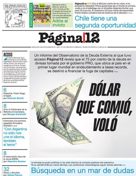
Figura 15: Tapa diario Página 12 , lunes 20 de noviembre, del 2017.

A diferencia de lo que sucedió con Clarín , la desaparición del submarino no forma parte de la portada del día domingo. Volvemos a encontrar la noticia recién el día siguiente. La desaparición del submarino no forma parte de las noticias más destacadas para Página 12 , ya que nuevamente las críticas al gobierno tienen un rol protagónico. El título -“Es búsqueda en un mar de dudas”-, y la bajada destacan que la Armada no pudo confirmar los intentos de contacto mencionan las malas condiciones climáticas mientras se buscaba la nave. El resto de la portada continúa con noticias de interés político y económico en donde se destaca su mirada crítica.