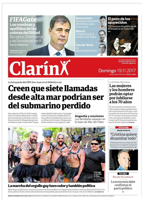
Figura 13: Tapa diario Clarín , domingo 19 de noviembre, del 2017.

La desaparición del submarino continuó siendo un tema central para el diario Clarín , esta vez en la tirada de domingo. El título -“Creen que siete llamadas desde alta mar podrían ser del submarino perdido”-, una vez más demuestra cómo el diario está dispuesto a darle un seguimiento contundente a la noticia,