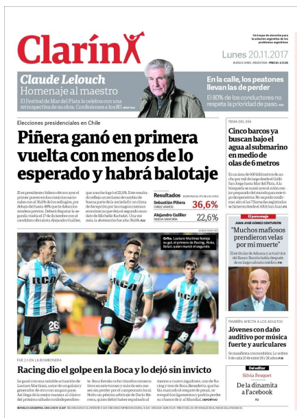
Figura 14: Tapa diario Clarín, lunes 20 de noviembre, del 2017

En Clarín y por tercer día consecutivo, encontramos al ARA San Juan dentro de las noticias principales pero ya como Tema del día.