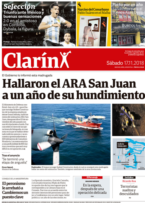
Figura 16: Tapa diario Clarín, sábado 17 de noviembre, del 2018.

Es un título directo y meramente informativo -“Hallaron el ARA San Juan a un año de su hundimiento”-, y describe brevemente lo acontecido hacía pocas horas en alta mar. A simple vista podemos ver que Clarín no intenta darle una mirada política al hecho.