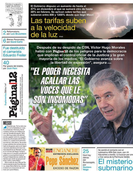
Figura 9: Tapa diario Página 12, sábado 18 de noviembre, del 2017.

En esta portada al igual que en las ediciones anteriores podremos ver cómo continúa la reiterada crítica al gobierno de Cambiemos, principalmente a la figura del expresidente. El diario continúa dando lugar a voces opositoras y en menor grado de relevancia expone notas de interés general.