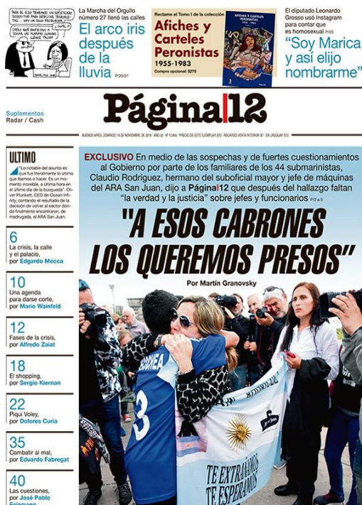
Figura 17: Tapa diario Página 12 , Domingo 18 de noviembre, del 2018.

En esta edición el diario Página 12 intentó alzar la voz de los familiares de la tripulación y no hay datos concretos sobre la búsqueda y aparición de la nave.