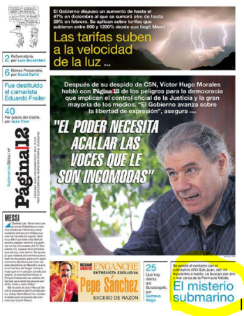
Figura 4: Tapa diario Página 12, sábado 18 de noviembre, del 2017.

Esto lo podemos observar con el posicionamiento de Página 12 respecto a la noticia de la desaparición del submarino, como ya veremos más adelante en un primer momento la noticia aparece relegada para tiempo después de la aparición de la nave transformarse en un tema central para el diario. Esto lo podremos ver en las siguientes portadas en donde se ve como el interés del diario sobre el tema aumentó a medida que el hecho puede comprometer al oficialismo.