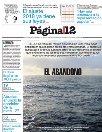
Figura 5: Tapa diario Página 12, jueves 28 de diciembre, del 2017.

También realizando una comparativa entre los diferentes medios podremos enriquecer nuestro análisis, veremos qué datos cobran mayor importancia de acuerdo al interés de la editorial y qué herramientas se utilizan para convalidar un titular.