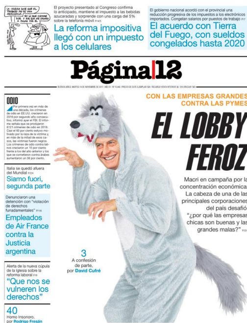
Figura 8: Tapa diario Página 12 , lunes 13 de noviembre.

El título de la noticia principal es “El lobby feroz”, con Macri en el centro de la portada. Se utiliza un juego de palabras para hacer alusión al cuento clásico: nuevamente se usa un término despectivo como “lobby” para referirse al expresidente. Al igual que en las anteriores ediciones de Página 12 , la tapa gira en torno a las críticas al gobierno de Macri. Veremos cómo a lo largo de las etapas