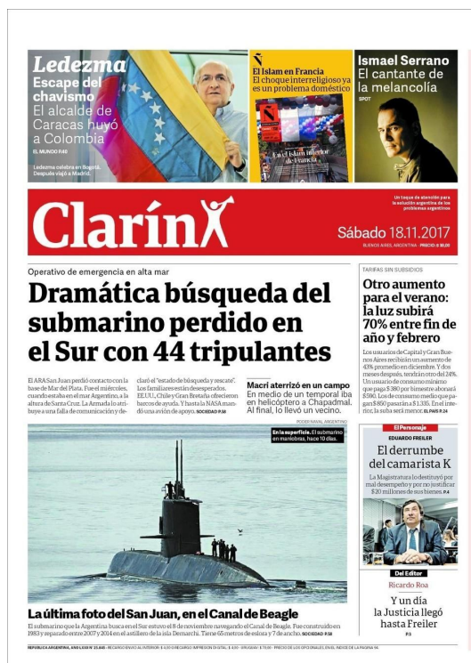
Figura 12: Tapa diario Clarín, sábado 18 de noviembre, del 2017.

La primera noticia sobre la aparición del submarino tanto en Clarín como en Página 12 fue el 18 de noviembre de 2017. El primero colocó la novedad en la portada de su edición matutina. Nos propone una lectura similar a la de días anteriores. Esta vez lo llamativo es que la noticia principal refiere a un hecho que no está ligado directamente con la política o los casos de corrupción. Vemos cómo un tema de interés general toma el protagonismo de la tapa del diario.