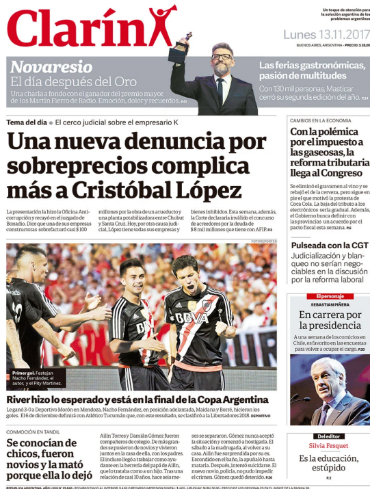
Figura 10: Tapa diario Clarín, lunes 13 de noviembre del 2017.

La portada de esta edición de Clarín es bastante diferente a las analizadas hasta ahora. El formato del diario es uno tabloide más tradicional, con colores más vivos, abundantes fotografías que acompañan a sus respectivas noticias y una mayor diversidad en la temática de las mismas. No encontramos caricaturas, ni primeros planos de personas vinculadas a la política nacional.