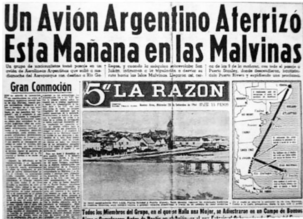
Ilustración 5 Diario la Razón 28 de septiembre de 1966