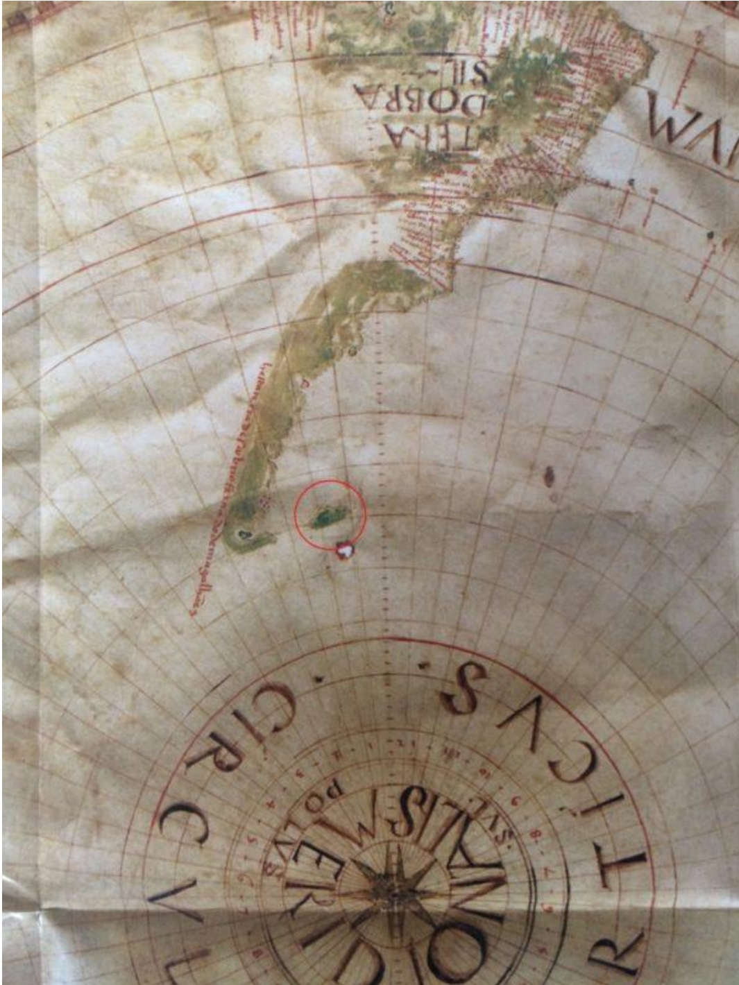
Ilustración 3 Mapa de Pedro Reinel del año 1522 donde se observan las Islas.

Una excelente y muy detallada descripción del descubrimiento y asentamiento en las islas la hace Paul Groussac (1936), considerando que “Existe un consenso general en atribuir al navegante holandés Sebald de Weert el descubrimiento de las Malvinas, el 24 de enero de 1600” (pág. 106), desde entonces comenzaron a figurar en las cartas de navegación como Islas Sebaldes o Sebaldinas . Nuevamente