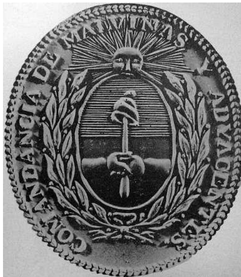
Ilustración 4: Escudo de la Comandancia Político Militar de las Islas Malvinas.

El del 10 de junio de 1829 el gobierno de Buenos Aires dio origen a la Comandancia Político Militar de las Islas Malvinas, cargo para el cual fue designado Luis Vernet, comerciante de origen hamburgués que tenía un plan de desarrollo para las islas. Frente a esta acción, el representante inglés en Buenos Aires, Woodbine Parish, realizó una protesta formal.