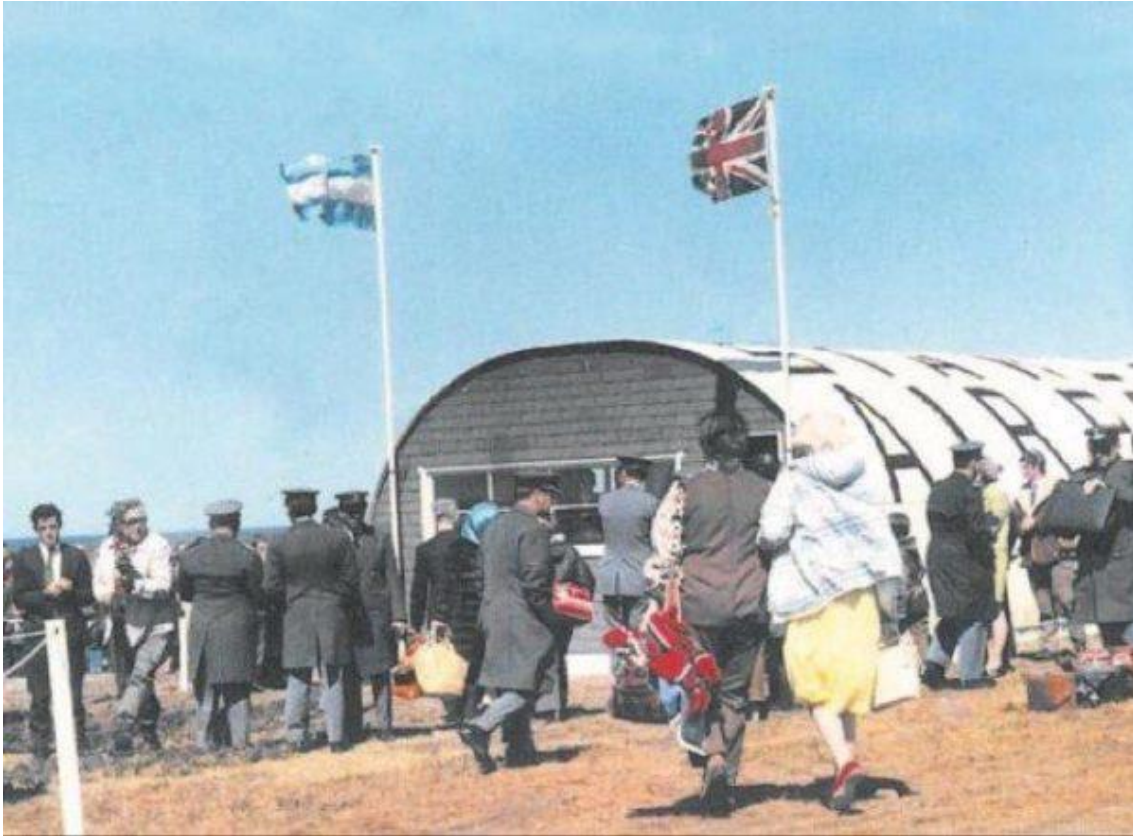
Ilustración 6 Inauguración de la pista de aterrizaje en 1972. Fuente: (Kohen & Rodríguez, 2016)

Estos acuerdos se realizaron el marco de las resoluciones de la ONU, por lo que se informaba de los avances y con el objetivo último de proseguir con las negociaciones sobre la soberanía, pero la situación se volvió a estancar cuando los isleños rechazaron, en octubre de 1973, las salvaguardas ofrecidas por Argentina. En este contexto el RU reintrodujo la cuestión de la libre determinación expresando que